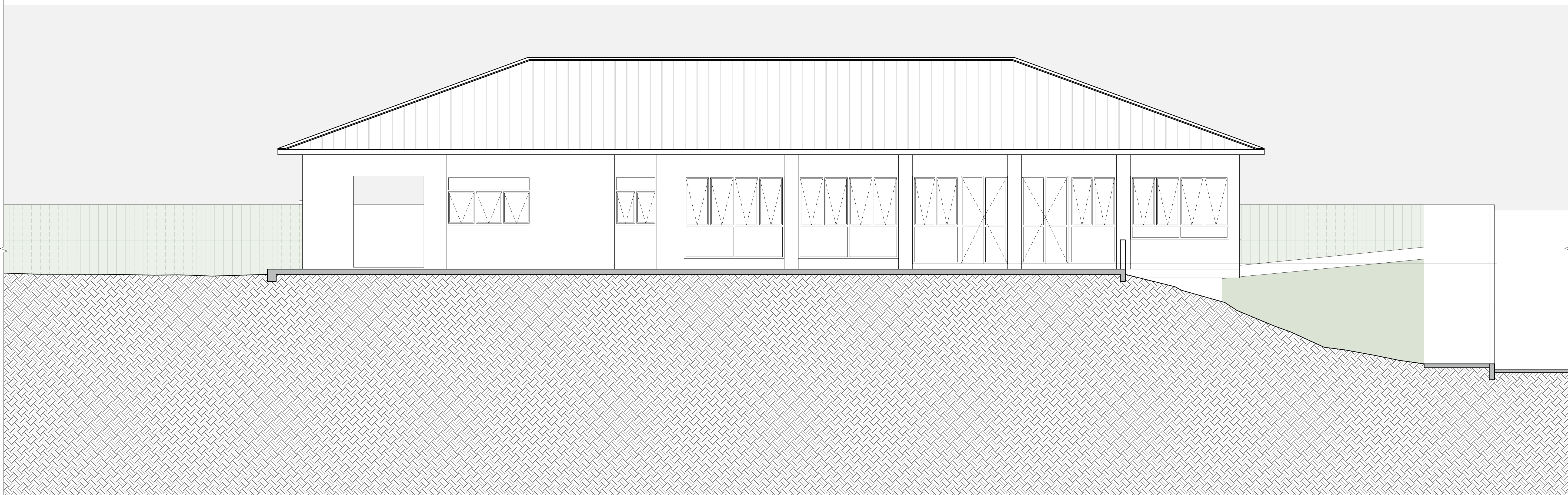
01 ELEVÇÃO LESTE ESCALA 1:50